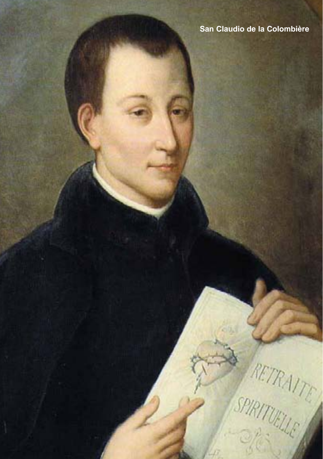
San Claudio de la Colombière